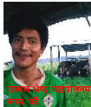
उज्वल श्रेष्ठ गाईपालनमा काम गर्दै