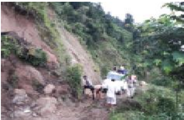
वर्षाले कटारी-इनामे खण्डको सडकमा खसेको पहिरो पन्छाउदै यानु ।

गाईघाट-दिक्तेल सडक कार्यालयले सडक स्तरोन्नतिको