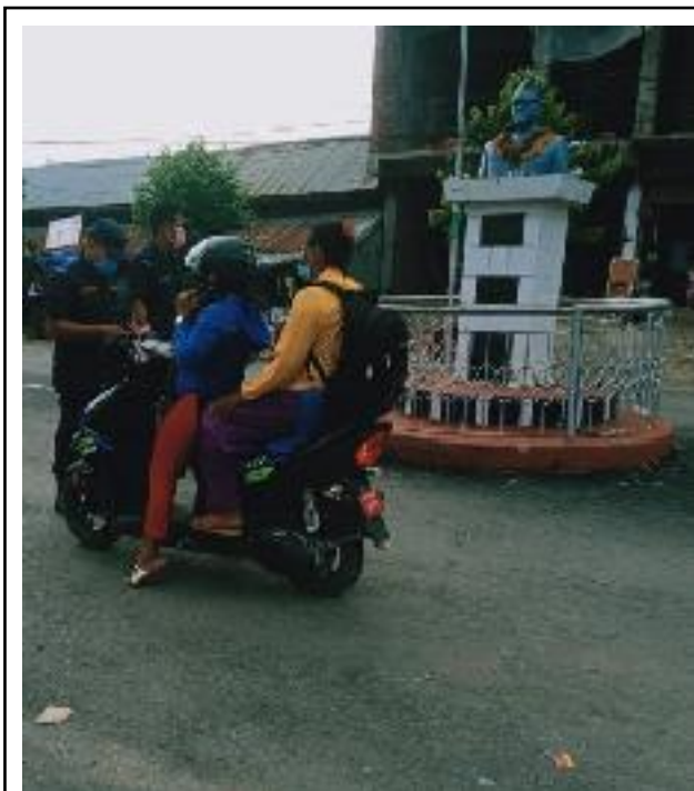
उदयपुर जिल्लाको पुर्वी चौदण्डीगढी नगरपालिका ७ बेल्टार बजारको पुष्पलाल चौकमा मास्क नलगाउने सर्वसाधारण, कर्मचारीलाई एक सय जरीवाना काट्दै बेल्टारका प्रहरी।

एमबिएस व्यावस्थापन संकाय र शिक्षा संकायको नेपाली अग्रेजी र पाठ्यक्रममा ४ वटा प्रवेश परिक्षा दिन सकिन्छ। यस क्याम्पसमा मास्टर पढाई हुन थालेको १५ वर्ष भईसकेको छ। त्यसको लागि ४० जनाको क्वेटा रहेको हुन्छ। आइ सिटिको अर्को प्राविधिक विषय स्नातक तह रहेको छ। २०६३ सालमा +२ देखि मास्टर तहसम्म २५ सय विद्यार्थीले अध्ययन गरेका थिए अहिले २९ सय जति विद्यार्थीहरु अध्ययन गरि रहेका छन्।