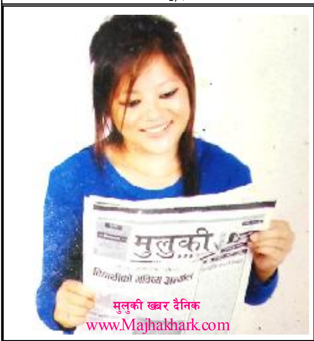
मुलुकी खबर दैनिक www.Majhakhark.com

हिमाली संघ केन्द्रमा कसैले एउटा कसैले ४ जना मिलेर लगानी लगाएका छन् । हिमाली संघ भित्र अटो पनि रहेको र कुनै दर्ता नभएको अटोहरू दुर्घटनामा पर्दा असजिलो हुने गरेको छ । व्यावसायीहरूले गाडि भाडा बढाएको होइन सरकारले पेट्रोलको मुल्य बढाएकाले राज्यले भाडा बढाएको यात्रुहरूले कुफनु पर्ने अध्यक्ष मैनालिको भनाइ रहेको छ ।