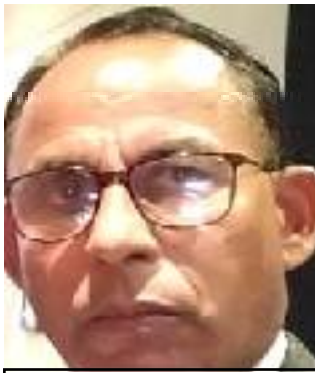
ओमभक्त मैनाली अध्यक्ष उदयपुर हिमाली यातायात व्यवशायी केन्द्र, उदयपुर

गाईघाट, साउन १३ उदयपुर हिमाली यातायात व्यवशायी केन्द्र, उदयपुरद्वारा उदयपुरबाट सञ्चालित सार्वजनिक सवारी साधनहरूमा अचाक्ली भाडा बृद्धि भएको छ। नेपाल सरकारले सघ संस्था रहित नयाँ दर्ता गर्नको लागि परिमार्जित संस्थाबाट फेरि संस्था दर्ता गराएपछि विगतमा हिमाली यातायात व्यवशायी संघ रहेको उक्त संस्था अहिले उदयपुर