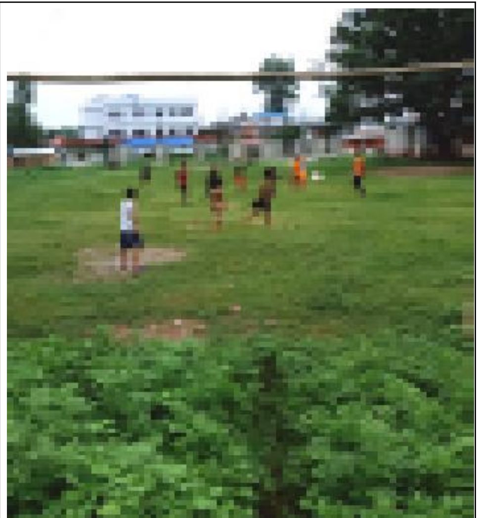
फुटबल खेलको आकर्षण। उदयपुर जिल्लाको सदरमुकाम गाईघाट बोक्से स्थित बालमन्दिर माध्यमिक विद्यालय परिसरमा रहेको खुल्ला क्षेत्रमा फुटबल खेल्दै बोक्सेका फुटबलप्रेमी खेलाडीहरू।

थप गरिएको अतिरिक्त ३० मिनेट भने स्वीडेनलाई फलदायी भएन। ९९ औं मिनेटमा डिफेन्डर मार्क्स ड्यानिलसनले रातो कार्ड पाएपछि स्वीडेन दश खेलाडीमा खुम्चिनुपरेको थियो। उनले युक्रेनका आर्टम बेसेडीनलाई फाउल गरेका थिए। ईटालीका रेफ्री डेनिल ओर्साटोले सुरुमा मार्क्सलाई पहिलो कार्ड दिएपनि भिडियो असिस्टेन्ट रेफ्री (भार) को मद्दतमा रातो कार्ड दिएका थिए। युक्रेनले स्वीडेन दश खेलाडीमा घटेको मौकको फाइदा उठाउन सफल पनि भयो। युक्रेन खेल सकिन अन्तिम केहि मिनेट बाँकी रहदा - बाँकी ३ पेजमा