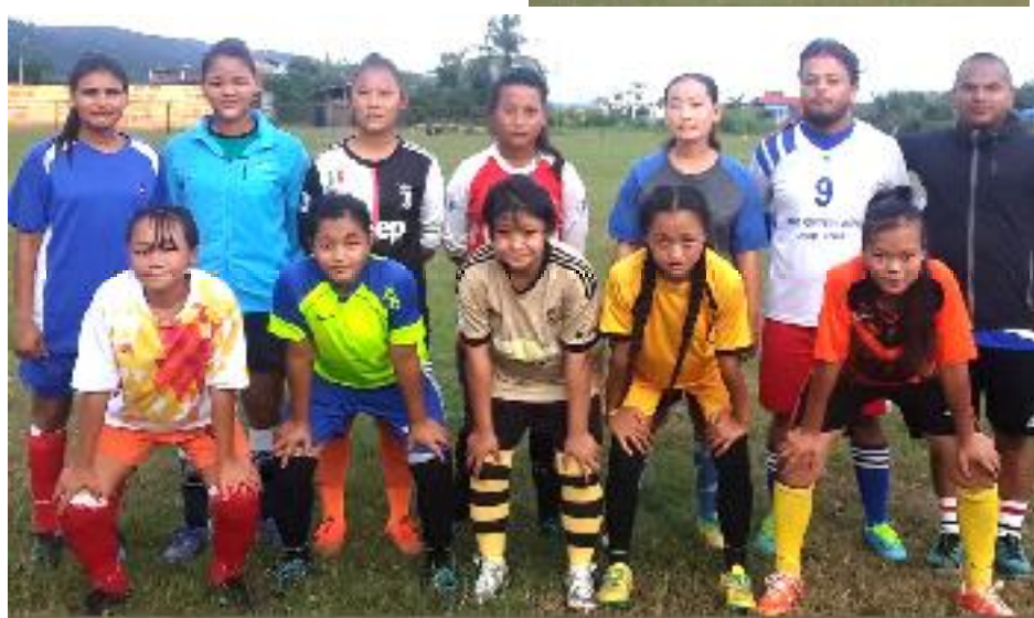
उदयपुर गाईघाटका महिला फुटबल खेलाडीहरू