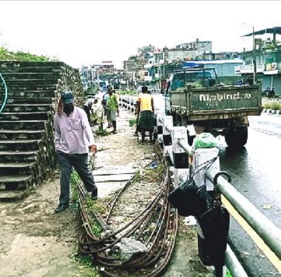
सडकपेटिमा व्यापारिको मनोमानी। उदयपुर जिल्लाको सदरमुकाम गाईघाट बजारको मध्य भाग भयर जाने मदन भण्डारि लोकमार्गको सेतो पुल श्रमिक पार्कमुनि रहेको सडकपेटिमा स्थानिय हार्डवेयर पसलले फलामे रड राखेर सडकपेटि अवरुद्ध गरिरहेका छन।

२०६३ साल वैशाख ७ गते बुधवारदेखि प्रकाशन सुरु भएको मुलुकी खबर दैनिक आगामी २०७८ साल भदौ १८ गते शुक्रवार १६ औं वार्षिक उत्सवमा मुलुकी दैनिक कस्तो लाग्दछ? लेख शुभकामना विज्ञापन दिन इच्छुक व्यक्तिसंस्थाले सम्पर्क गर्नुहोला। सम्पर्क - बुद्धि कुमार राई सम्पादक ९८४२९८५१८८