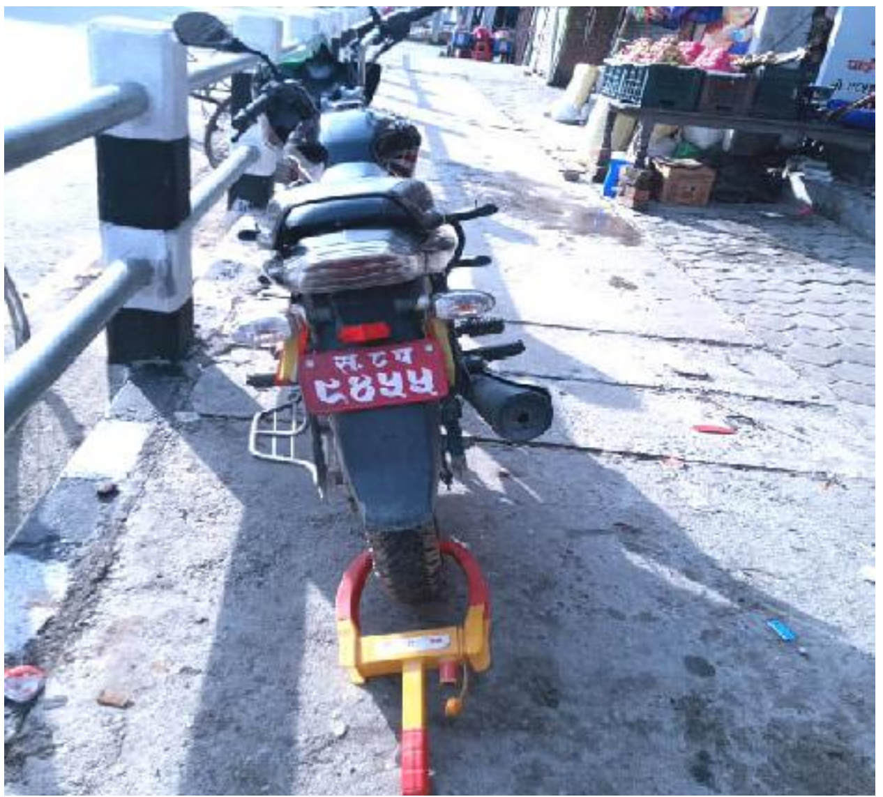
उदयपुर जिल्लाको सदरमुकाम गाईघाट बजारको मुख्यचोकको उमेश घडी पसस अगाडी पैदलयात्रु हिड्ने सडकपेटिमा मोटरसाईकल चालकले मोटरसाईकल पार्क गरेपछि, जिल्ला ट्राफिक प्रहरी कार्यालय उदयपुरले मोटरसाईकलको पाङ्गामा लक लगाएको छ। मंगलबार विहान ७ बजे लगाएको लक बेलुकी ७ बजेसम्म पनि मोटरसाईकल धनी सम्पर्कमा नआएपछि, ह्यान्डिल लक मोटरसाईकललाई अटोमा राखेर कारवाहीको लागि जिल्ला ट्राफिक प्रहरी कार्यालय लगेको छ। अहिले गाईघाटको ट्राफिक प्रहरी कडाईका साथ कारवाहीमा उत्रेको छ।

इन्टरनेट सेवा दिने संस्था कम्पनीहरूले अब ग्राहकलाई सहज, सुविधासम्पन्न, सरल तरिकाले कसरी इन्टरनेट सेवा चलाउन सकिन्छ त्यसरीनै अबको योजनाहरू बनाईनुपर्दछ। लहरको भरमा गुणस्तरविहिन सेवाको शुल्क भने पुरा लिन पाईने नियममा पनि विचार गर्न जरुरी छ। इन्टरनेट सेवा बिना अहिलेको दैनिकी चलाउन असहज भएकाले पनि इन्टरनेट सेवा संस्थाहरू सेवामुखी हुनुपर्दछ। नाफा कमाउने भन्दा पनि आफ्नो ग्राहकहरू टिकाईरहन अब सेवामा गुणस्तर दिनैपर्दछ। नाफा मात्र कमाउने हो भने यस्ता इन्टरनेट सेवाका सुविधा कसैको कोठाहरूमा यो सेवा बन्द हुनेछ। जति धेरै सेवा सुविधा बढायो उति धेरै ग्राहक सङ्ख्या बढ्छ भने सेवाको स्तर बृद्धि गर्दा नै सबै उपभोक्ताहरूको मनमा बस्न सक्छ। त्यसैले सबैको हित हुनेछ। धेरै राम्रो सेवा प्रदान गर्ने हो भने अझ सेवाग्राही बढ्ने छ।