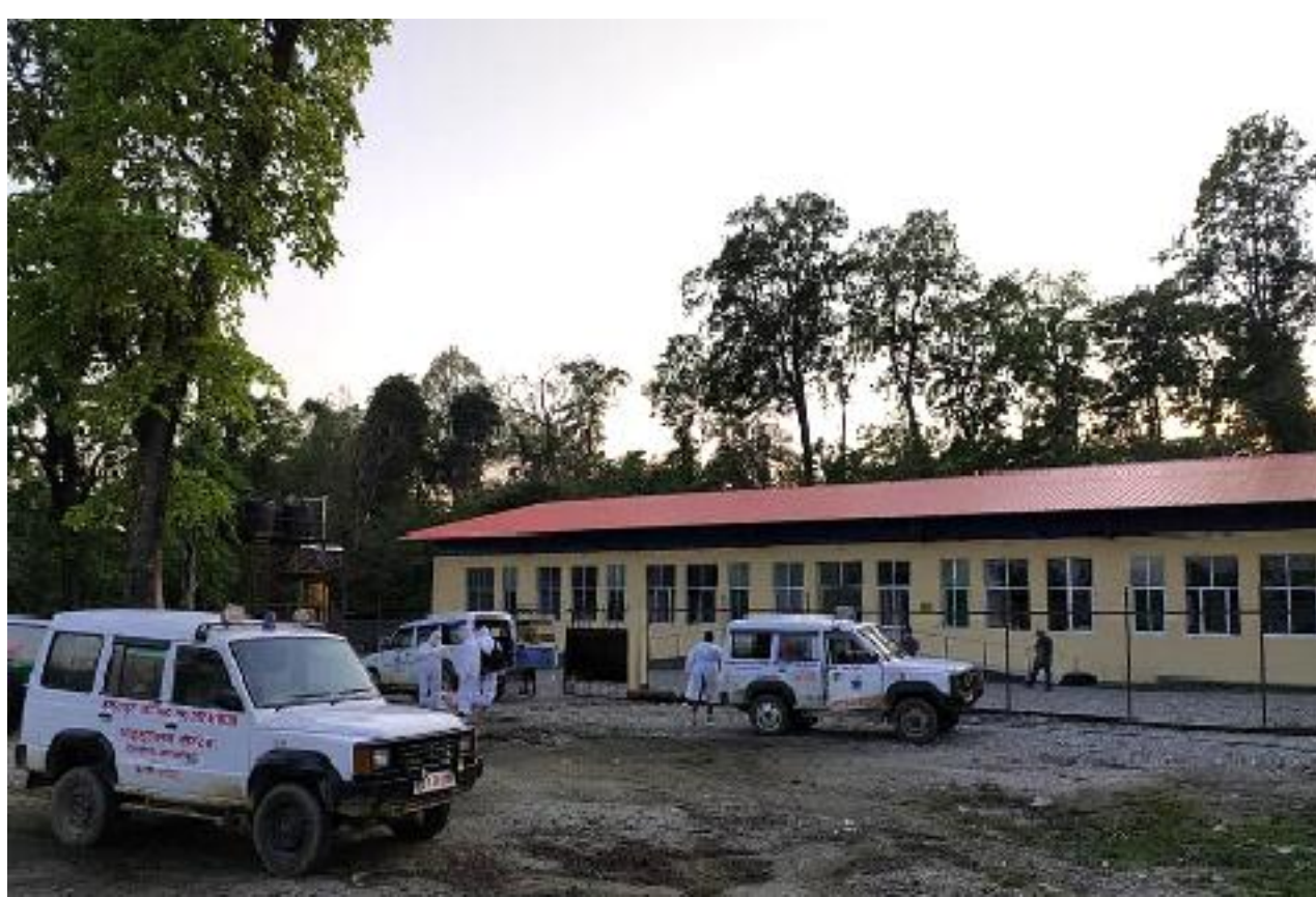
एम्बुलेन्सको ओहोरदोहोर । उदयपुरमा बाढेको कोविड संक्रमणले चौदण्डीगढी ६ सातधारे बेलटारस्थित उदयपुर कोविड अस्पतालमा आईतबार विरामी ल्याएका एम्बुलेन्सहरु ।

यो सँगै उदयपुर अस्पतालमा अक्सिजनको समस्या हाललाई टरेको छ । अस्पतालसँग २५ थान सिलिण्डर यसअघि थियो । जसबाट अस्पताल भनाई भएर उपचाररत बाँकी २ पेजमा