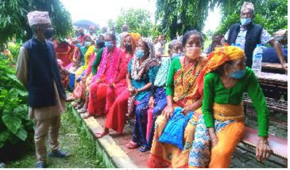
मंगलवार गाईघाट माविको खोपकेन्द्रमा कोरोना भाईरसको खोप लगाउन आएका त्रियुगा नगर पालिकाका ५५ वर्ष माथिका वृद्धवृद्धाहरु ।

उदयपुर, साउन १२ उदयपुरमा अधिल्लो दिनदेखि सुरु भएको कोविडविरुद्धको खोप हान्नेको संख्या साढे ७ हजार पुगेको छ । गत ९ गते दिउसो आईपुगको चाईनिज कम्पनीको भेरोसिल खोप विभिन्न स्थानीयतहहरुले