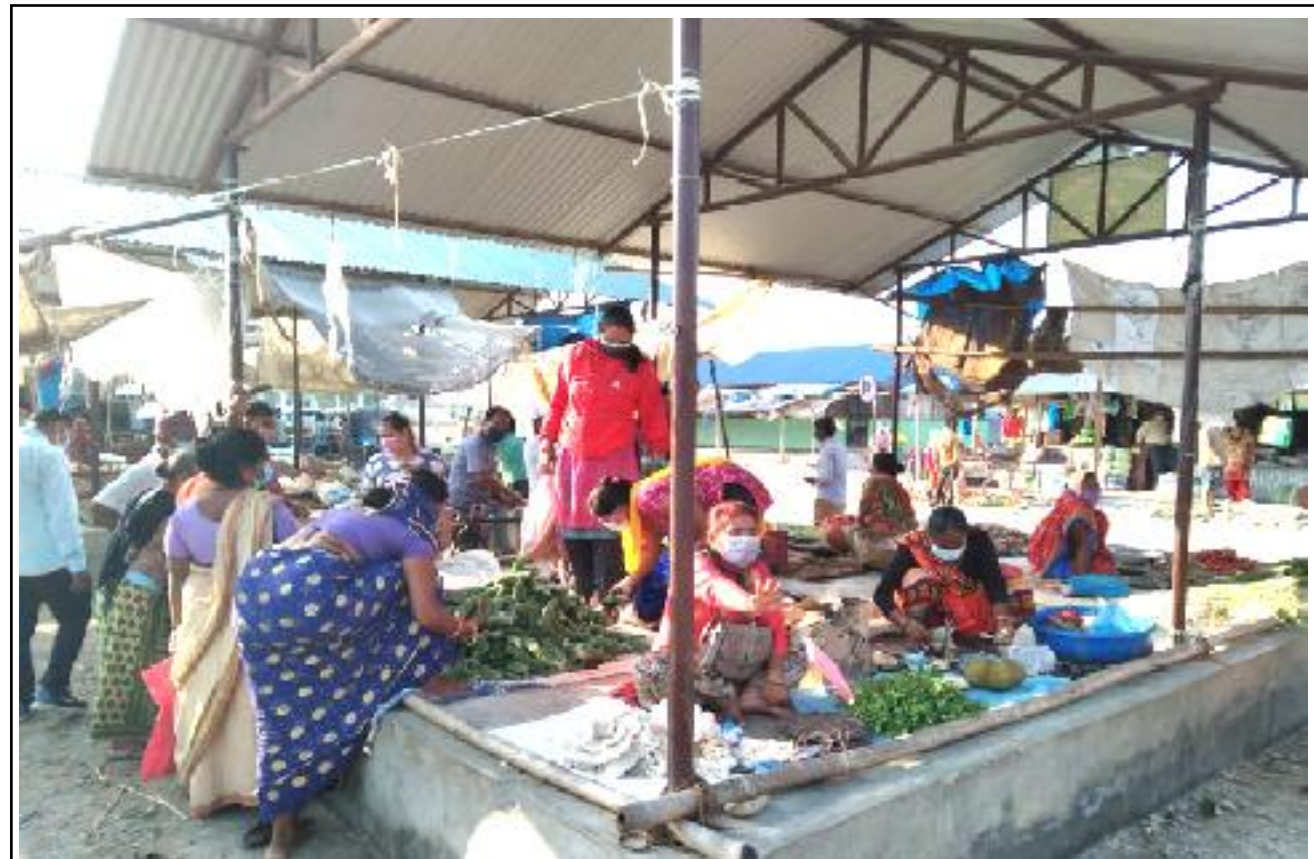
सामाजिक दुरीको खिल्ली: शनिबार बिहान उदयपुरको सदरमुकाम गाईघाट स्थित तरकारी बजारमा मानिसहरुको भिड । स्थानियहरुले सामाजिक दुरी ख्याल नगर्दा संक्रमण सार्ने खतरा हुन्छ ।

परिवारले थाहा पाएर सहयोग मागेपछि मुम्बईबाट घर ल्याउन विभिन्न व्यक्ति र संस्थाले सहयोग गरेको परिवारले जनाएको छ । हराएको छोरो घर आए पनि पक्षाघात (प्यारालाइसिस) भएको परिवारले जनाएको छ । उनको उपचारका लागि परिवारले सहयोगको याचना गरेको छ ।